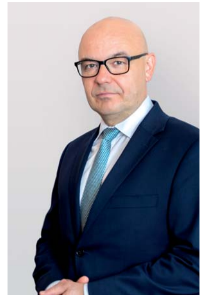
Filip Nowak p.o. Prezesa Narodowego Funduszu Zdrowia

p.o. Prezesa Narodowego Funduszu Zdrowia