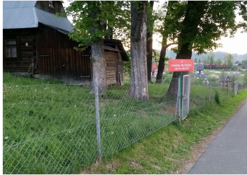
Fot. pomnik przyrody – grupa drzew przy ul. Mrowce 5