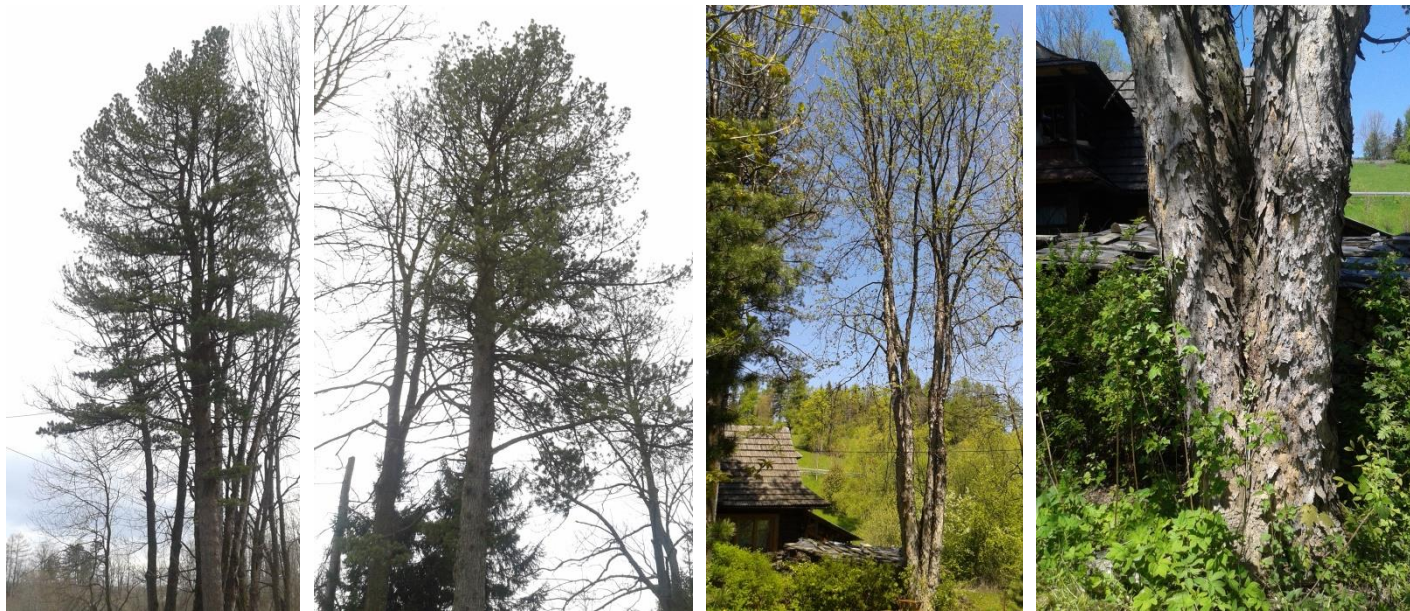
Fot. pomniki przyrody (sosna limba i grupa 5 drzew – klon jawor) przy ul. Sobczakówka 9a i 10 utworzone w 2015r. przez Radę Miasta Zakopane.