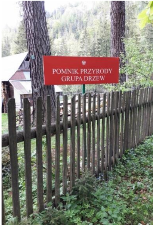
Fot. pomnik przyrody – grupa drzew przy ul. Przew. Tatrzańskich 11

Zgodnie z art. 127 pkt 2 lit. a ustawy o ochronie przyrody kto umyślnie narusza zakazy obowiązujące w stosunku do pomników przyrody – podlega karze aresztu albo grzywny.