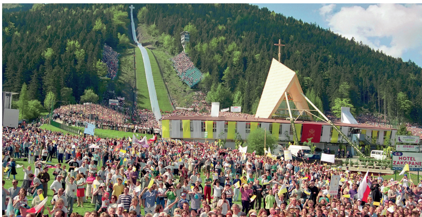
Wielka Krokiew. W oczekiwaniu na Mszę św. na Wielkiej Krokwi, 6 czerwca 1997