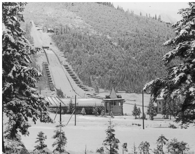
Wielka Krokiew - widok ogólny skoczni po przebudowie, grudzień 1938 r.