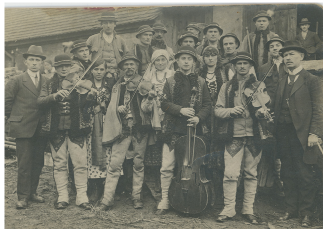
Związek Górali podczas agitacji plebiscytowej na Górnym Śląsku, 1921 r.