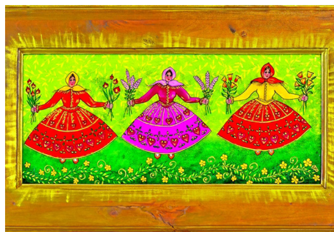
Bożena Doleżuchowicz Mickiewicz, malarstwo na szkle