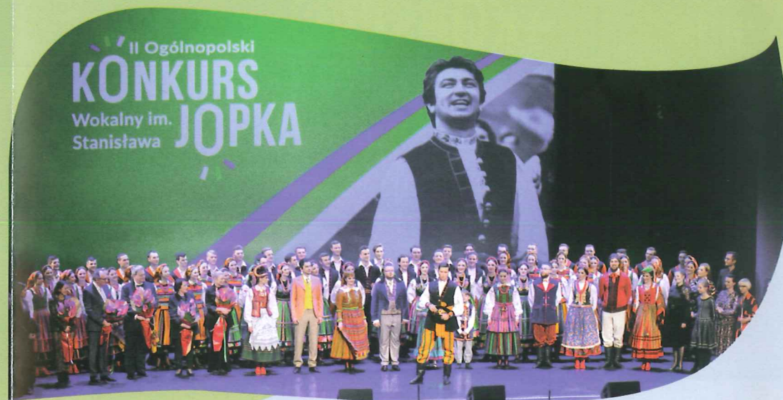
Koncert Galowy II edycji Ogólnopolskiego Konkursu Wokalnego im. Stanisława Jopka Otrębusy, październik 2021 r.